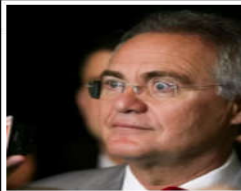
Senador Renan Calheiros

noticias.uol.com.br/politica/ultimas-noticias/2021/04/16/mdb-apoiara-renan-calheiros-como-relator-da-cpi-da-covid.htm